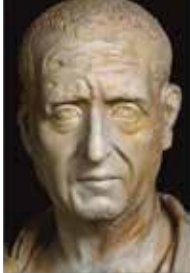
Bildnis des Kaisers Decius (Rom, Kapitolinische Museen)

Dieser Vortrag geht den verschiedenen Faktoren nach, wie das römische Reich in eine schwere Krise geriet und schließlich von zwei Kaisern gerettet und konsolidiert wurde. Diokletian führte eine administrative und Konstantin eine religiöse Wende ein. Die Umgestaltung des Prinzipats in ein Dominat bewirkte, dass das römische Reich noch für weitere zwei Jahrhunderte bestehen blieb.