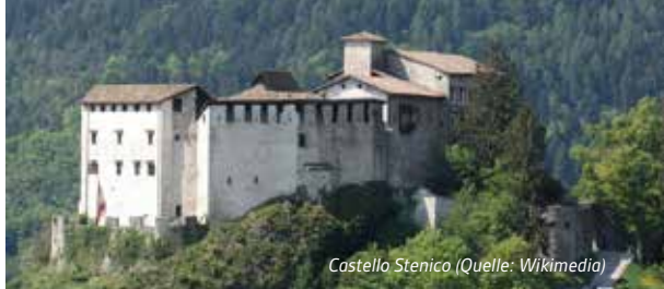
Castello Stenico

gelegenen Friedhofskirchen von Pinzolo (San Vigilio) und Carisolo (Santo Stefano), die beide ein ausdrucksstarkes Totentanzfresko des Simone II Bascheni aus dem frühen 16. Jahrhundert zeigen. Die Stadt Trient selbst wurde Zeuge einer der welt- und religionsgeschichtlich wichtigsten Zusammenkünfte der katholischen Kirche, des Konzils von Trient (1545–1563), das als Reaktion auf die Reformation eine Umstrukturierung und Abschaffung von Mißständen in der katholischen Kirche einleitete. Die Stadt wurde mit neuen Bauten und Restaurierungen vom mächtigen Bischof Bernardo di Cles für dieses Konzils direkt vorbereitet. Das Stadtbild wird bis heute davon geprägt. Neben den kulturgeschichtlichen Besonderheiten weist das Trentino natürlich eine grandiose Landschaft und geologische Besonderheiten – eine besondere Art von Verwitterung – auf, wie die Erdpyramiden von Segonzano . Die naturkundliche, vor allem geologische und paläontologie Seite, bzw. die Überreste aus der Zeit der Kelten und Römer werden im Museo Tridentino di Scienze Naturali zu bewundern sein.