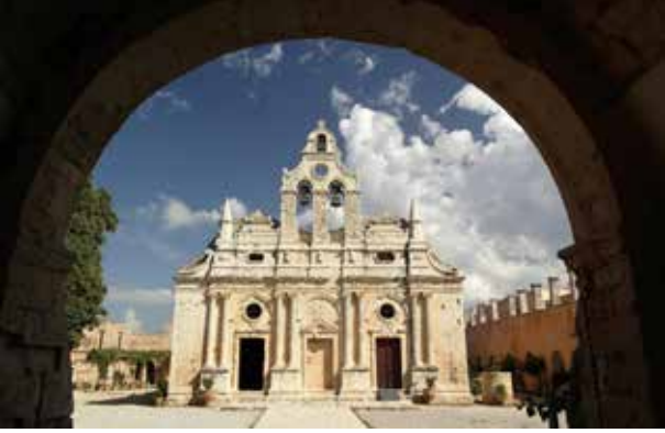
Kloster Arkadi, Kreta