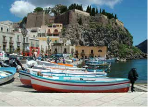
Hafen von Lipari*

entwickelte sich eine weitere Blütezeit. Aus dieser Zeit stammen ein Benediktinerkloster und die sehenswerte Kirche San Bartolomeo. Diese Studienfahrt wird nicht nur aufgrund der archäologischen Zeugnisse, sondern durch die landschaftlichen Eindrücke der vulkanischen Inselwelt in besonderer Erinnerung bleiben.