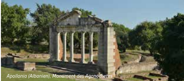
Apollonia (Albanien), Monument des Agonothetes