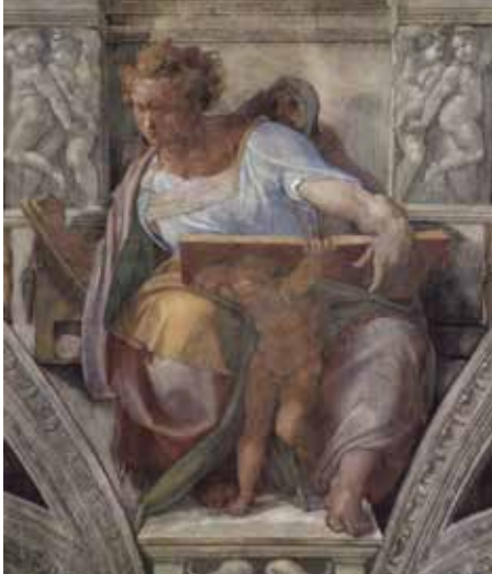
Der Prophet Daniel in einem Fresko in der Sixtinischen Kapelle des Vatikan Michelangelo Buonarroti, 1509. (Wikimedia, gemeinfrei)

Werk wiederum ist nicht zu denken ohne den Einfluss Savonarolas und die eigene Beteiligung an den innerkirchlichen Reformbestrebungen seiner Zeit. So verbindet Luther und Michelangelo bei allen Unterschieden in der historischen Wirkung und der medialen Ausformung ihrer Absichten ein gemeinsames kirchenkritisches und reformorientiertes Interesse. Diese Konstellation ist in der Geschichtsschreibung bisher nicht beachtet und ist doch in der Lage, die europäische Dimension der Reformationsgeschichte in den Blick zu bekommen.